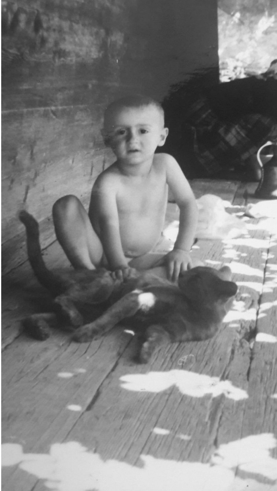
Şavşat, Gulan 1988