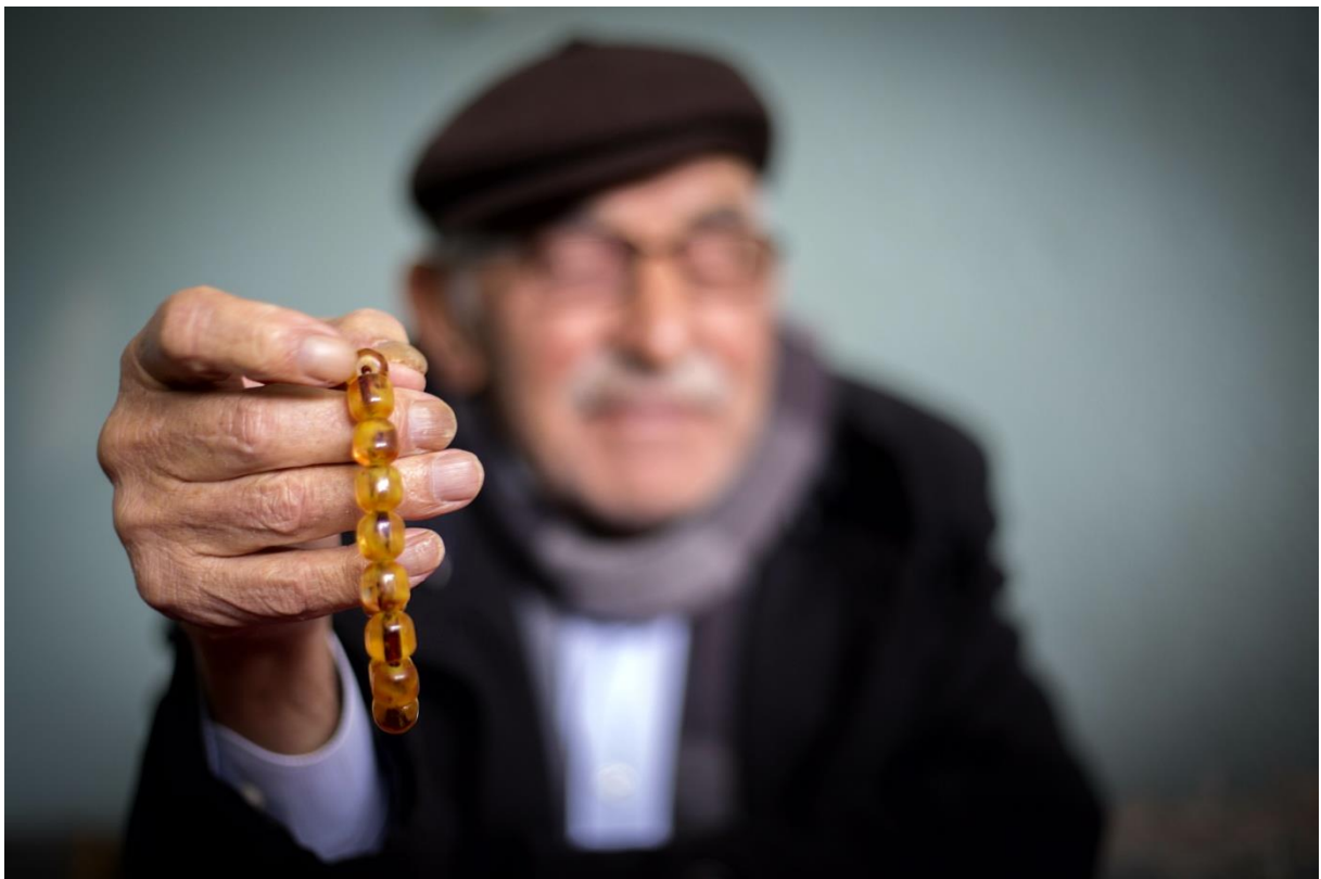
Foto: Mem Artemêt Çavdêrî Li Qehwexaneyeka Derez Çêrme - Çewlîg, Çile 2019