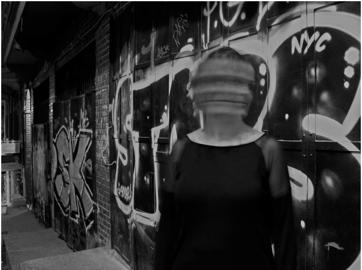
Jinên Ji Dinyê Birçî Radibin Stenbol - 2015

Dirûbûn jî ji nexweşiyên xwe yê nexweşik nexşan çê dike, li ser jîyanê... Lê kî dikare rûyên xwe yê piralî yê bi xêlîyên hezar salî ji şevê veşêre... Ew rûyên ku tu bê haya xwe di nav xwe de mezin dikî, tînî li ser destê şevê diweliidînî.